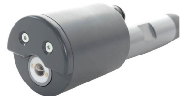
Autoclean 浸没式 序列号 : 36000030