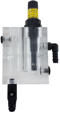
单开放式流通池 序列号 : 32100001