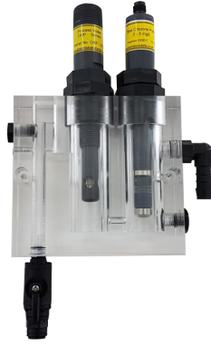
双开放式流通池 序列号 : 32100002