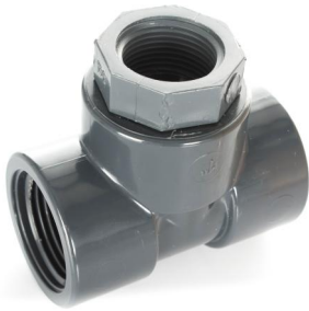
三通（拧入） 序列号 : 32100102