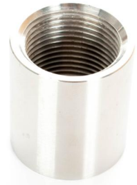
焊接短节（拧入） 序列号 : 32100106