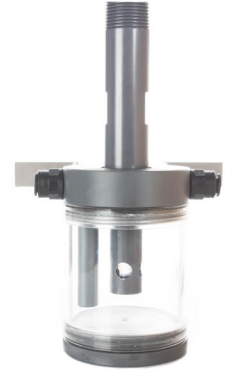
密闭式流通池 序列号 : 32100010