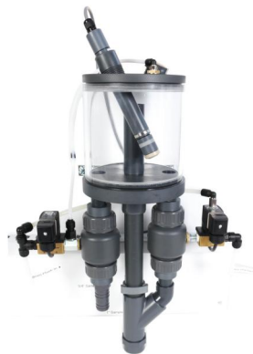
Autoflush 流通池 序列号 : 36500001