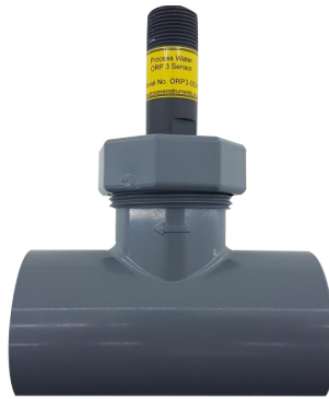
三通（快接） 序列号 : 32100103